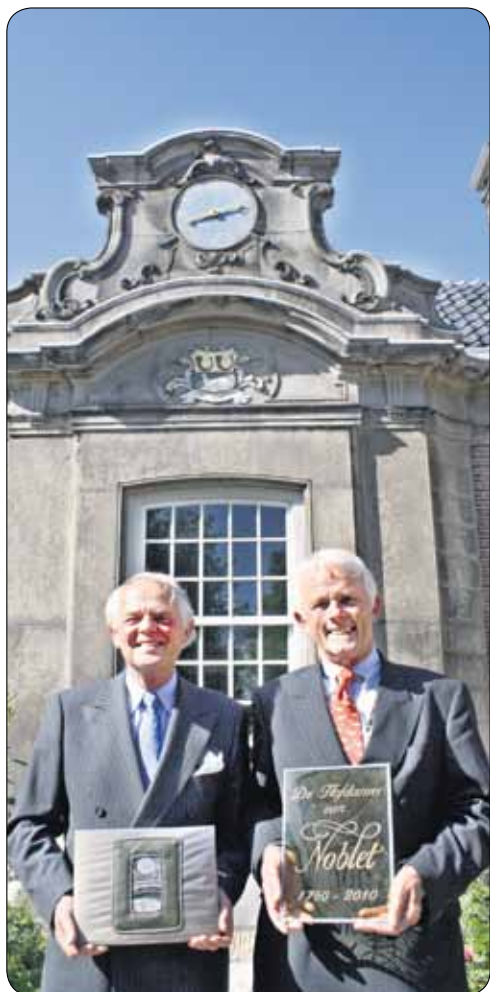
• Fier met de cadeaus van de hofdames, de regenten Stuart (l) en Termeijtelen