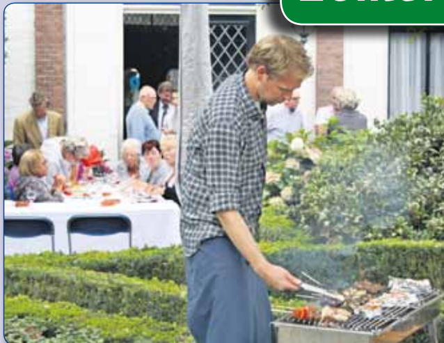
• HOFJE IN DEN GROENEN TUYN