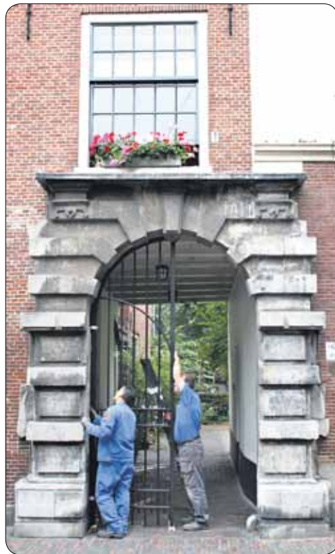
• Medewerkers van de Haarlemse Hekken Industrie aan het werk