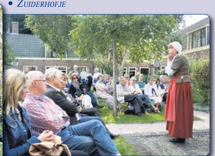
• FRANS LOENENHOFJE